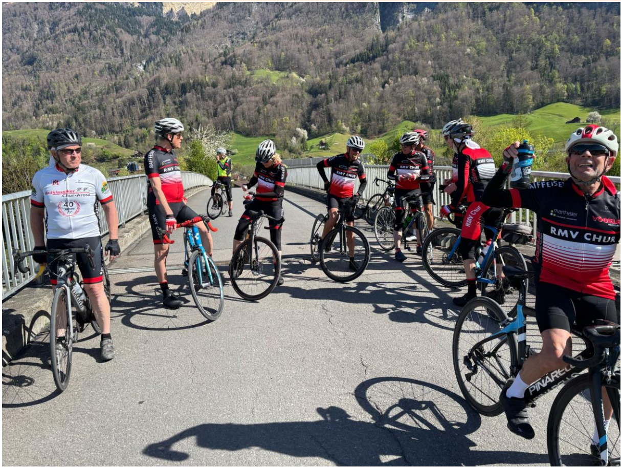
Mutig stehen die Radfahrer/innen auf dem Wiederlager der „UrsBrücke“ ☺